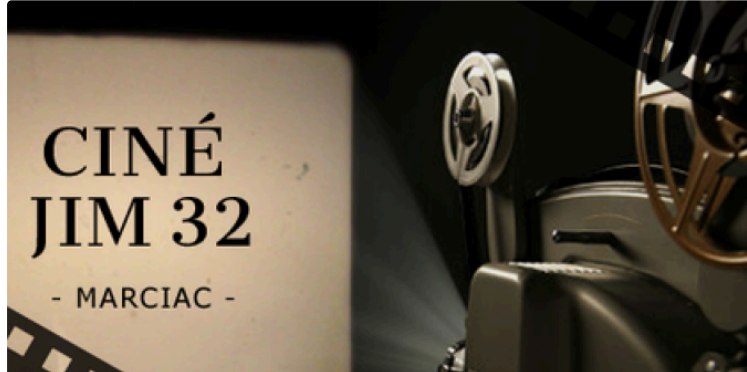
Ciné JIM 32

Suite aux dernières directives, le port du masque est désormais obligatoire dans tous les espaces du cinéma y compris pendant la projection (A partir de 11 ans). Les mesures de distanciation sont supprimées.