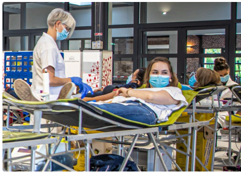
Gros plan sur un prélèvement