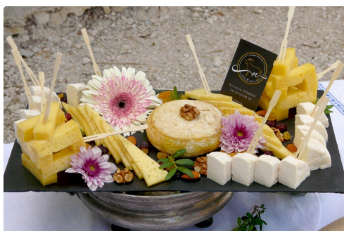
Ça ne vous donne pas envie ?