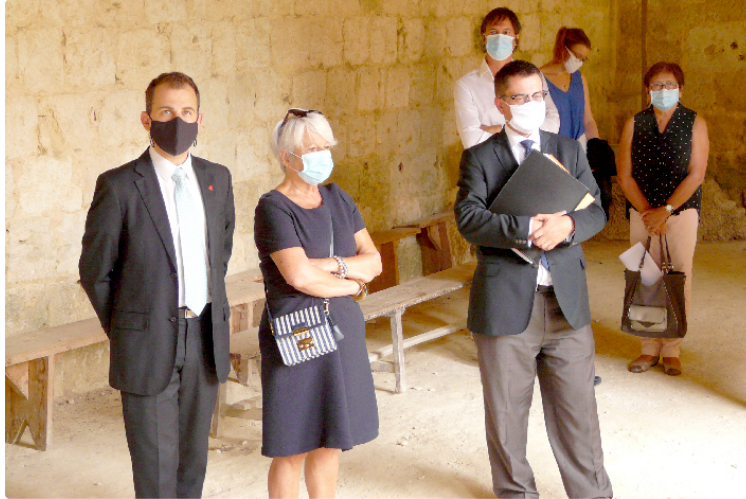
Visite de Monsieur le Préfet