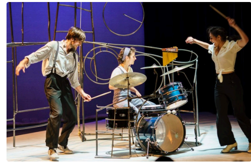
Lumière ! So Jazz