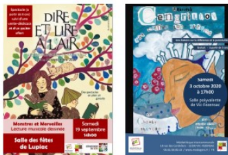
Médiathèque : une riche actualité en cette rentrée

Après 15 jours de vacances, la médiathèque a rouvert ses portes le mardi 25 août.