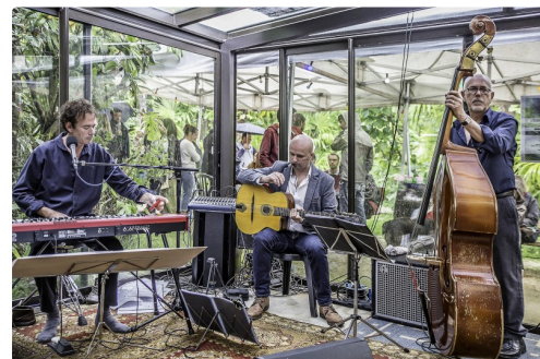
Pause du Myosotis Trio entre 2 chansons en juin 2017 à la Palmeraie