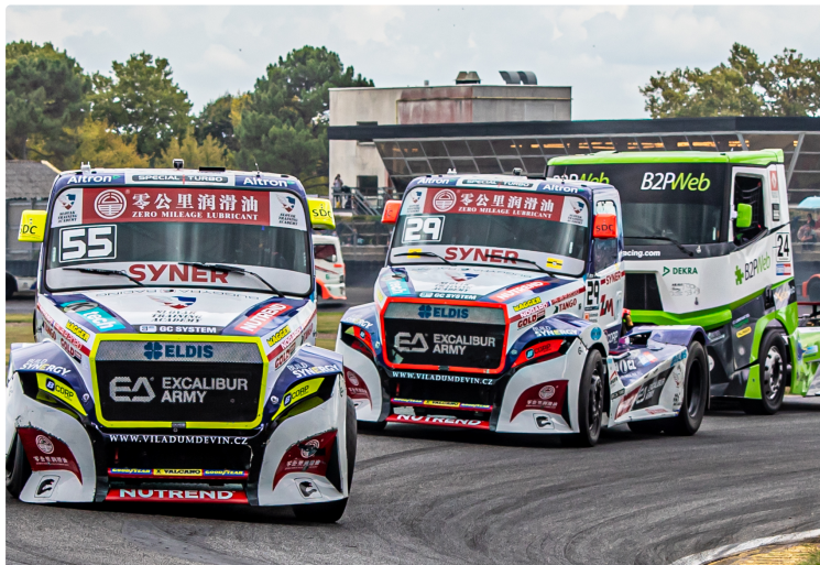
Grand Prix Camions digne des précédents à Nogaro

Samedi 5 et dimanche 6 septembre a eu lieu, au circuit de Nogaro, le Grand Prix Camions, repoussé depuis le printemps, pour cause de covid-19. Ce magnifique spectacle avait d'abord droit à 5 000 spectateurs à la fois, puis, très tardivement, ce nombre a été augmenté jusqu'à 6 500 personnes. Le public est venu : 3 089 payants le samedi et 4 050 le dimanche. Avec l'ensemble des invités, des membres de l'organisation, de la presse et des participants, il y a eu un total de 10 139 personnes sur le circuit pendant les deux jours. Ce n'est pas mal, compte tenu des circonstances.