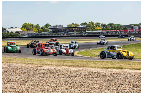
Legends Cars : début de la course 1