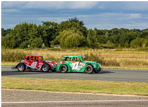
La poussette dans la ligne droite ?