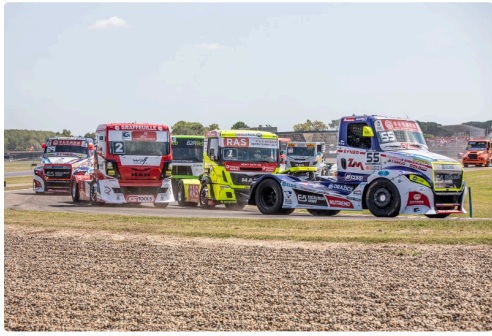
Dans la course 2

3e course (longue) : 1er Thibaut Chiron ; 2e : Maxime Lieutenant ; 3e : Maxime Sonntag.