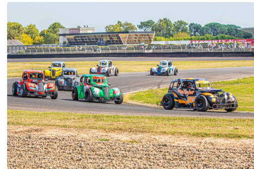
Legends Cars : situation en fin de course 1