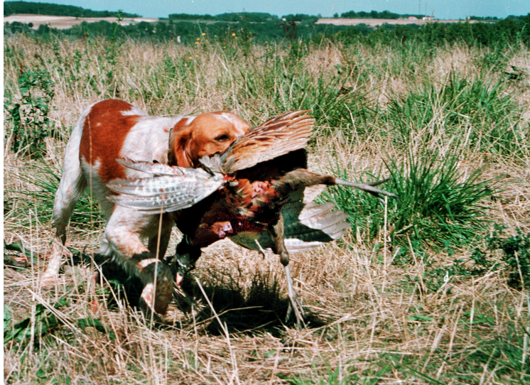
Chasse : ouverture dimanche... mais manif avant !

Dimanche 13 septembre aura lieu l'ouverture générale de la chasse. Mais les chasseurs feront entendre leur ras-le-bol samedi à Prades.