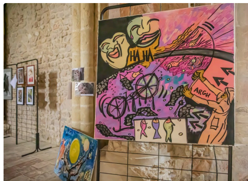
Gros plan sur le tableau de gauche de la photo ci-dessus