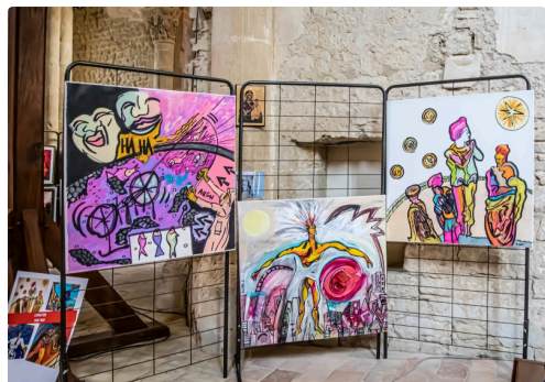
Tableaux de Nam Tran