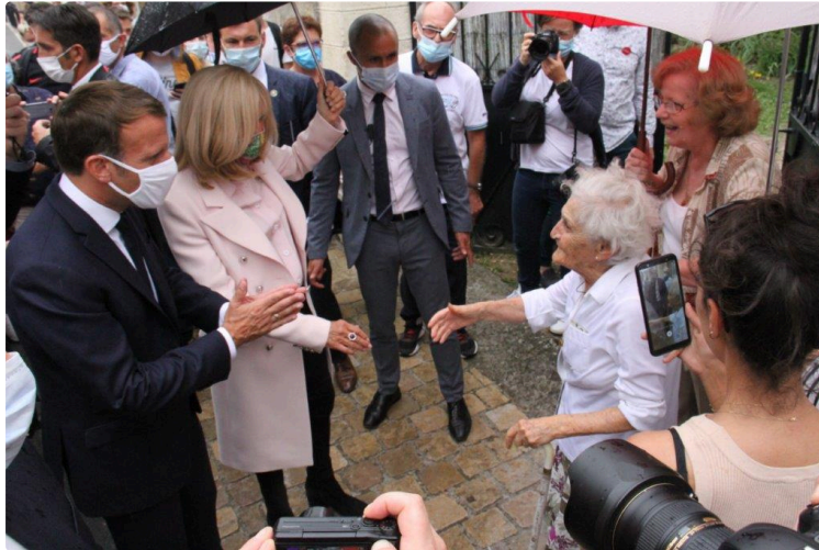
Le président de la République offre sa première venue, dans le Gers, aux Condomois.

Depuis François Mitterrand, le 27 septembre 1982, plus aucune visite officielle dans la sous-préfecture !