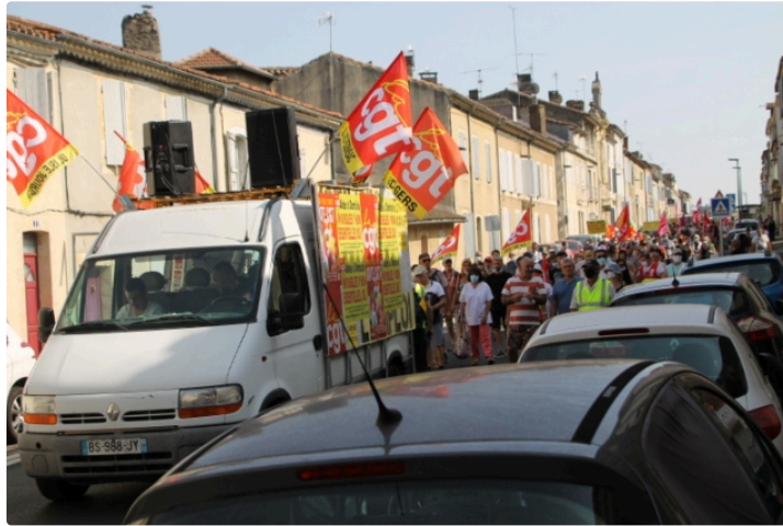
Journée nationale d'action du jeudi 17 septembre

Rassemblement jeudi dernier à 14h 30 devant la Préfecture pour l'intersyndical gersois. Les représentants syndicaux ont été reçus par le Préfet afin d'examiner les différents sujets concernant l'éducation, en particulier sur les remplacements des enseignants, l'aéronautique avec la crainte sur les emplois et la santé.