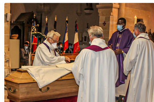
Dépôt des vêtements sacerdotaux du défunt