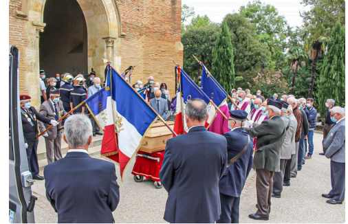
Hommage des drapeaux