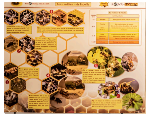
Panneau les métiers de l'abeille