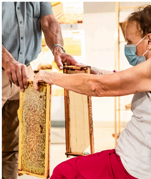
Cadre vierge et cadre rempli par abeilles