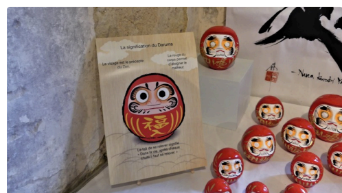
Avez-vous acheté votre daruma porte bonheur ?