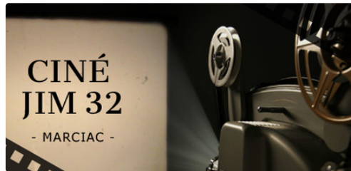
Ciné JIM 32

Programme du 29 septembre au 13 octobre 2020