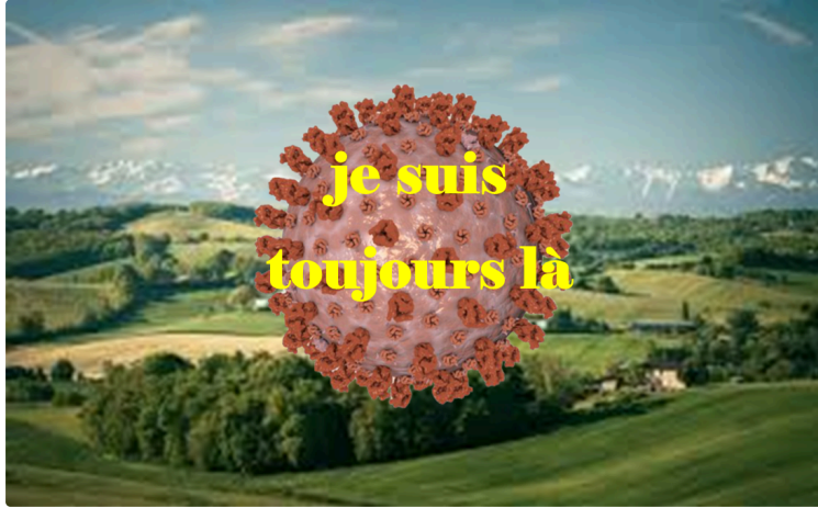
Le département du Gers est en "zone alerte " : nouvelles restrictions