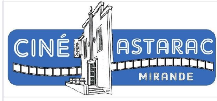
Cinéma de l'Astarac

Après les paysages des zones humides de "Wetlands" ce mercredi, ne manquez pas ce vendredi la rencontre à 19h avec les réalisateurs Boukherma et leur film "Teddy". Samedi soir pour les plus de 12 ans un film d'horreur avec "Antebellum"