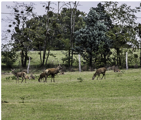
Cerf et biches