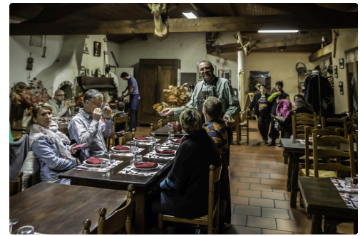
Le restaurant de la Ferme aux cerfs