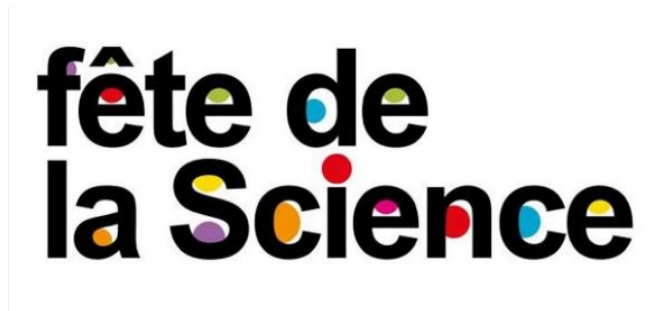
Fête de la science avec l'association à Ciel ouvert

La Fête de la Science est une manifestation nationale, dont l'objectif est de rassembler le public autour de différentes thématiques scientifiques pour les redécouvrir grâce à des ateliers ludiques et participatifs gratuits, animés par un collectif d'acteurs locaux de la médiation scientifique. En 2020, ce grand RDV aura pour thématique : la relation entre l'Humain et la Nature.