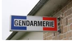
Avis de recherche de mineure

La gendarmerie du Gers lance un avis de recherche