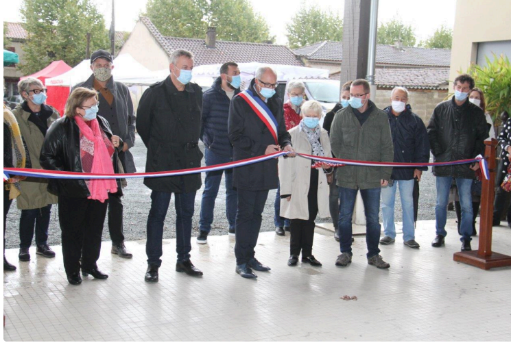
Le premier ruban coupé

Inauguration de la Halte de la Bouquerie, son nom dorénavant, un nouveau lieu de partages et de convivialité