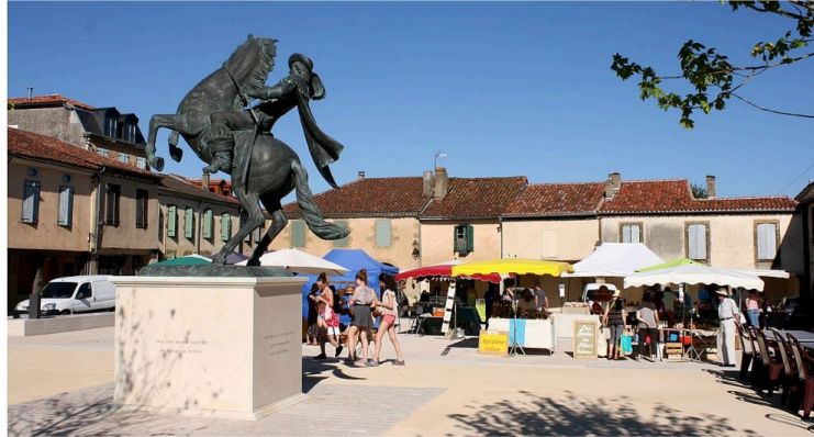
Exode urbain : Le Gers a la cote

Vivre au vert dans le Gers, le rêve de beaucoup de citadins