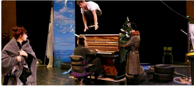
Grand Auch : On fait quoi ce week-end?

Du 16 au 25 octobre, le Festival CIRCa vous plonge au cœur des dernières créations les plus qualitatives des arts du cirque. Avec un peu moins d'animations pour vous assurer un accueil en toute sécurité, la 33e édition vous promet des beaux moments suspendus, remplis d'émotions. Et voici votre agenda des animations du vendredi au dimanche, dans le Grand Auch Cœur de Gascogne :