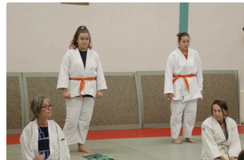
Kallya et Syriana.