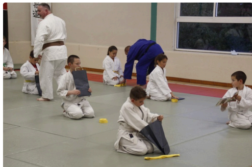
Remise des ceintures.