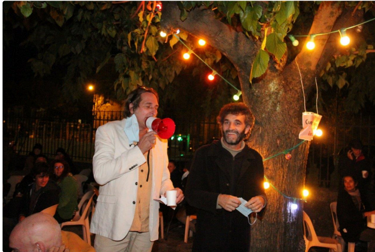
Un Oscar ou un César ? Pas un Lion d'Or non plus, mais simplement un Tarin d'Or

Le nouveau prix au palmarès du Festival du Film court en Armagnac.