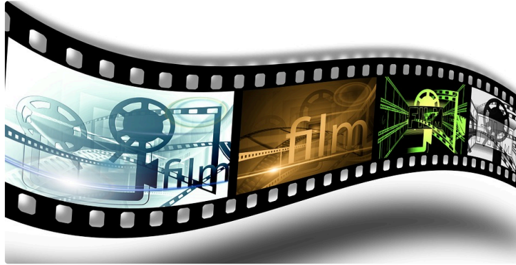
Au cinéma vendredi...