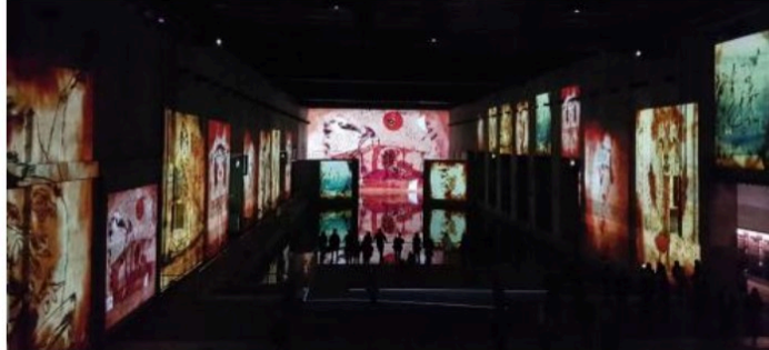
Le Bassin des Lumières à Bordeaux : une visite magique organisée par Confluences

C'est par une belle journée d'automne que l'association Confluences a organisé sa sortie culturelle annuelle à Bordeaux le samedi 17 octobre.