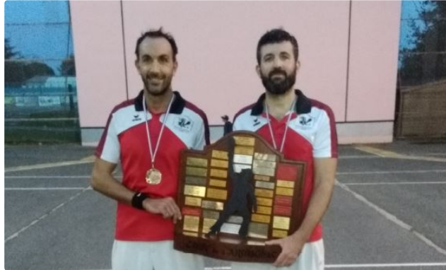
Le Pilotariak Auscitain repart une nouvelle fois avec le trophée

La récompense du Tournoi de l'Armagnac disputé à Mirande