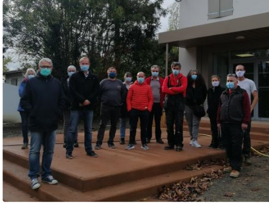
Une salle polyvalente flambant neuve pour Belmont

Lundi 26 octobre , c'était la dernière réunion de chantier qui marquait l'aboutissement d'un projet lancé en 2018 : la mise en accessibilité et la rénovation énergétique de la salle polyvalente de Belmont.