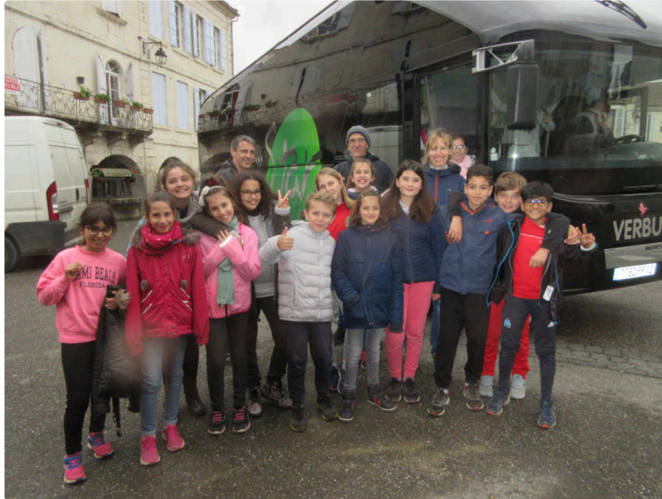
Faut-il vraiment se pencher sur son état de santé ?

La Bastide est-elle dans un état préoccupant ?