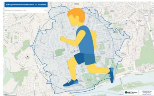
Comment appliquer la règle des 1 km pendant le confinement ?

Demain mercredi 11 novembre, jour férié, le temps devrait être clément et vous inciter à la promenade.