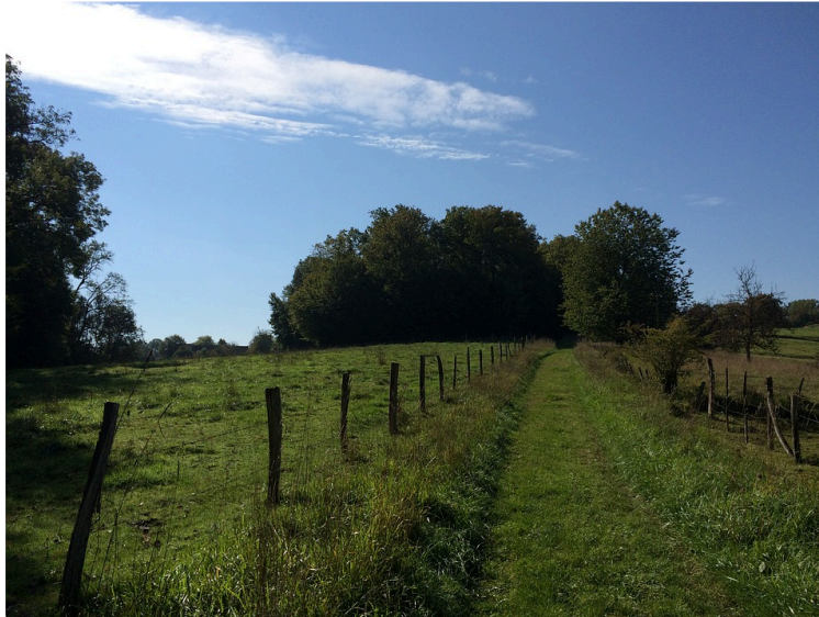
Laissez nous accéder à la #nature, risques infimes mais bénéfiques considérables !

La règle des "1km/1h quotidienne" n'a aucun sens au plan sanitaire et est contreproductive