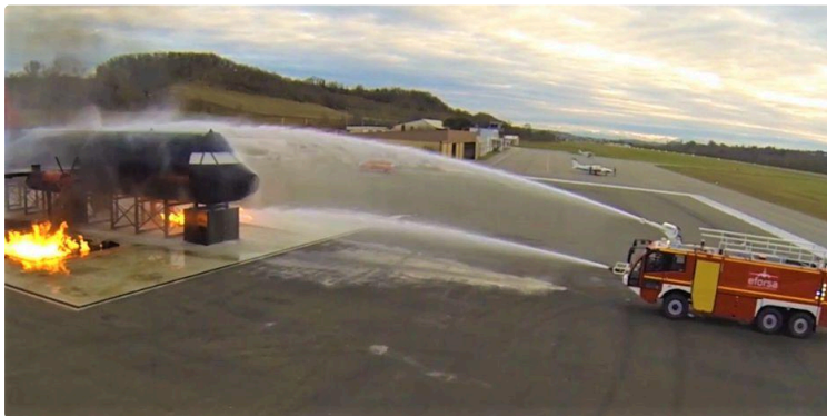
EFORSA : s'adapter à la crise sanitaire pour garder l'équilibre

L'École de Formation à la Sécurité Aérienne maintient le cap, malgré les trous d'air traversés en cette année singulière.