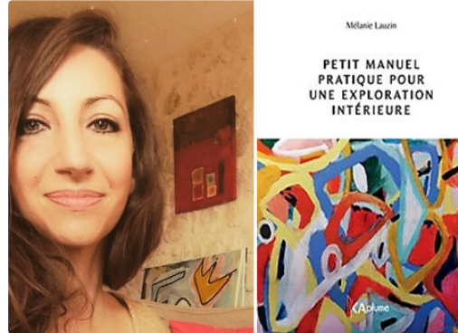
Petit manuel pratique pour une exploration intérieure

C'est un livre qui tombe à pic, en cette période de confinement bis, où chacun s'organise comme il peut pour ne pas sombrer dans une mélancolie, qui pourrait devenir pernicieuse.