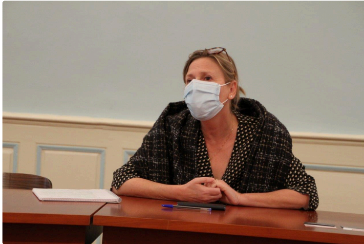
Du plat pays aux vallons gersois

Sa venue dans le Gers constitue une diagonale géographique et professionnelle