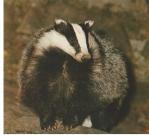
Histoires d'autrefois autour du blaireau...

Il existe encore dans le Gers quelques petits coins où l'on a préservé les haies aux branches touffues penchées sur la rivière comme au niveau de la digue de Bazian.