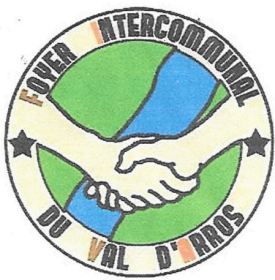
Logo FIVA journal.jpg

Nous comptons fortement cette année encore sur votre soutien malgré cette situation particulièrement difficile et remercions par avance tous les généreux donateurs qui pourront s'ils le souhaitent bénéficier de la déduction fiscale.