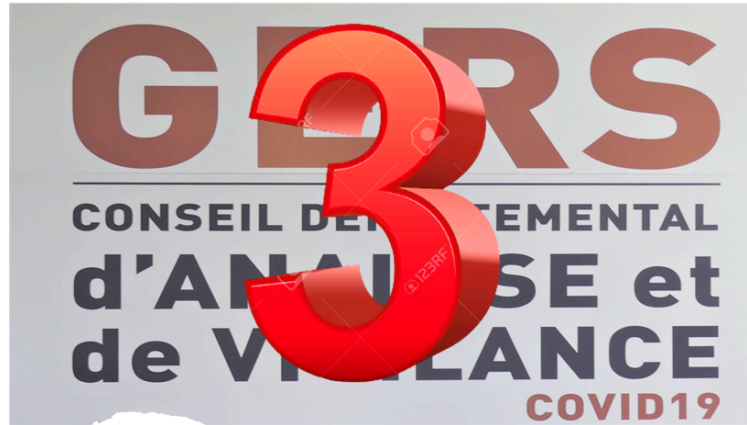
Conseil Départemental d'Analyse et de Vigilance COVID-19. N°3