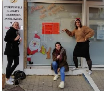
Les Mères Noël « anonymes » décorent les vitrines !

Peut-être avez-vous croisé hier après-midi un trio insolite, bonnet de Noël vissé sur la tête, escabeau sous le bras et feutres à la main.