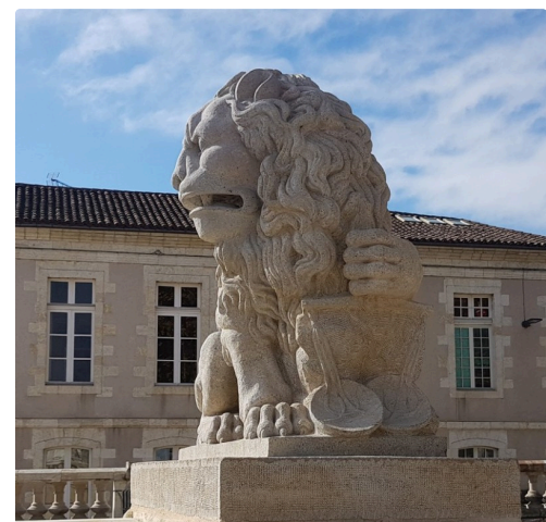
A gauche de la statue, le lion tenant la balance.