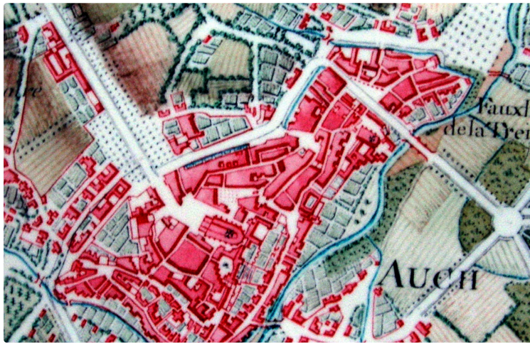
Le retour des lions près de la statue de l'intendant d'Etigny devant les Allées à Auch.

Récemment a eu lieu le retour des lions sculptés qui accompagnent la statue de l'intendant d'Etigny au début des allées d'Etigny. C'est l'achèvement de l'important programme de restauration mené par les municipalités d'Auch depuis une dizaine d'années.