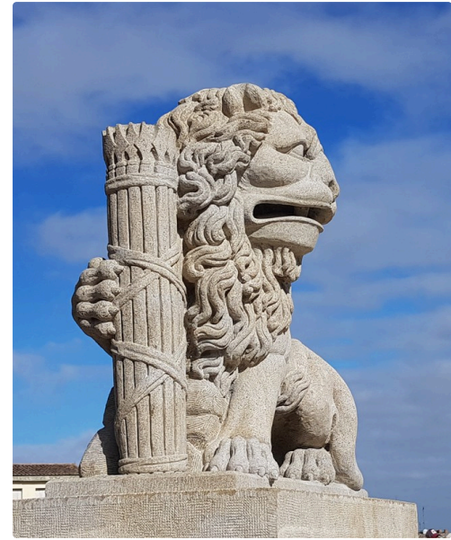
A droite de la statue, le lion tenant le faisceau « à l'antique ».