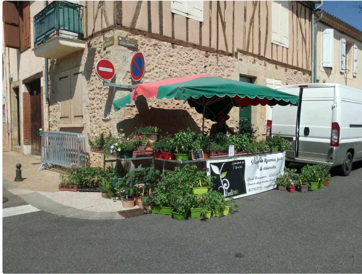
Une année inoubliable pour Laureline !

Oui, inoubliable ! Mais pas seulement à cause du Coronavirus.