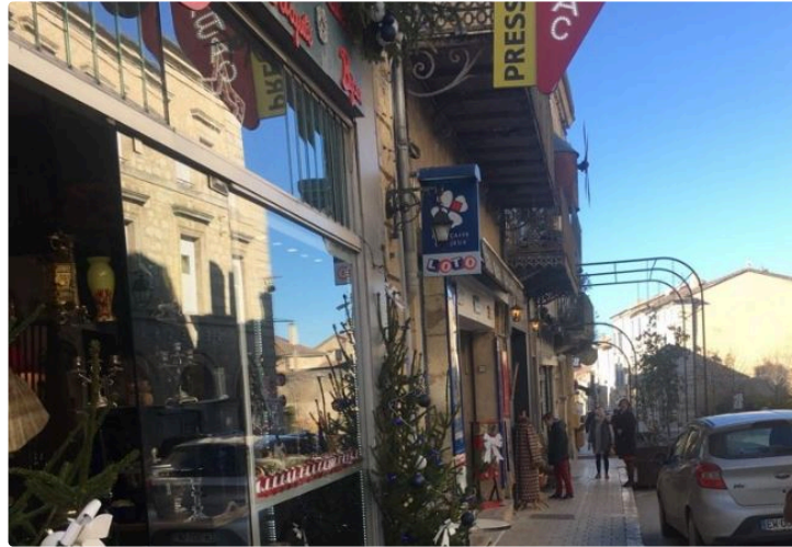
Enfin de bonnes nouvelles avec les informations de l'ACAL