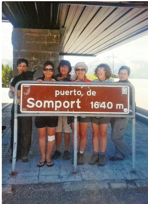
En 2014, traversée du Béarn puis arrivée au Somport.