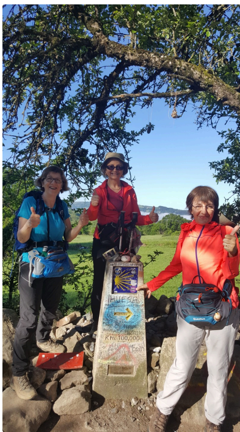
2019 ; pause photo devant la borne indiquant les 100 derniers kilomètres avant l'arrivée à Compostelle.