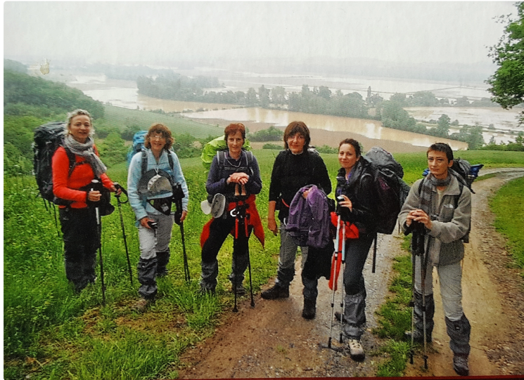
Six dames, un Chemin... un livre

Les Six Dames Étoiles de Compostelle, un ouvrage qui raconte le parcours de ces six Gersoises sur le célèbre Chemin.