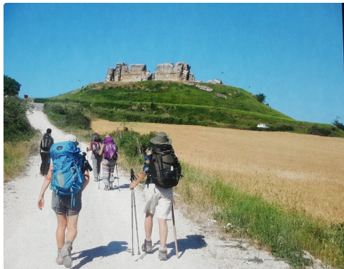
2015 ; en Espagne.