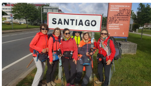
2019 ; arrivée à Santiago.