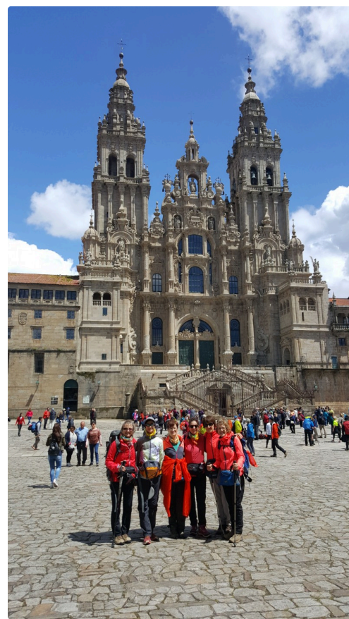
Dimanche 19 mai 2020 : la consécration avec l'arrivée à Saint-Jacques de Compostelle.