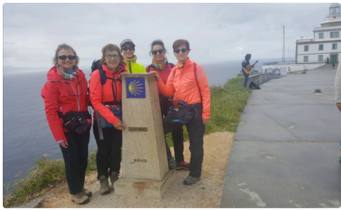
Au Cap Finisterra. Fin du voyage. Après l'arrivée à Saint-Jacques de Compostelle, les pèlerins ont la possibilité d'effectuer une marche de 100 km pour rejoindre le Cap Finisterra (bout du Monde pour les Celtes et au moyen âge).