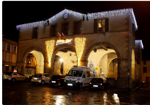
Mielan 07122020 (10) [1280x768].JPG