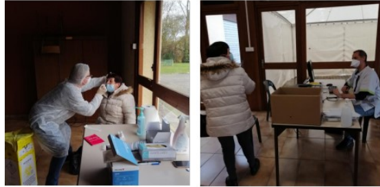
Des tests antigéniques en accès libre

Depuis lundi et pendant tout le mois de décembre, vous pouvez venir vous faire tester sans rendez-vous, gratuitement et sans ordonnance salle polyvalente à Vic-Fezensac.