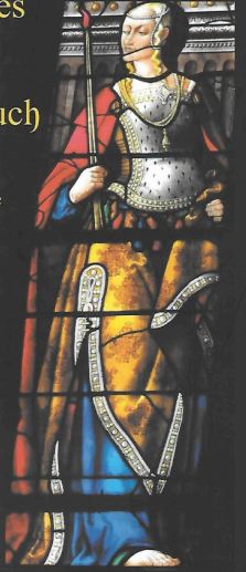
Arnaud de Moles Mengelle.jpg