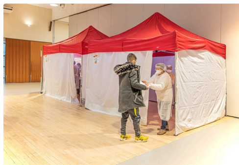
Les chapiteaux où ont lieu les dépistages