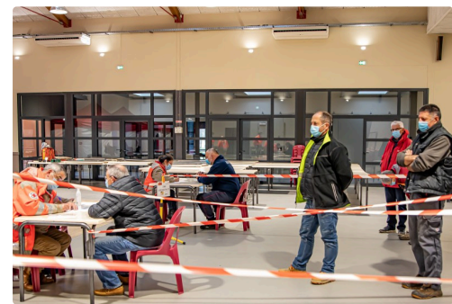
Accueil et inscription