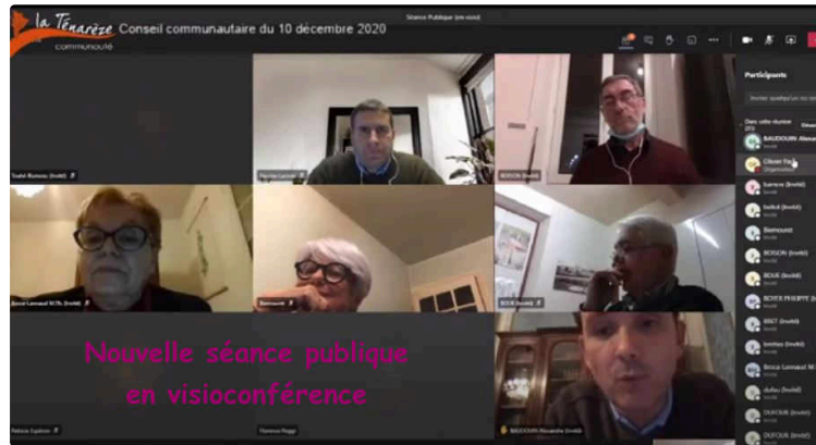
La CCT garde espoir pour une IRM dans la Ténarèze

Le Journal du Gers revient sur la dernière séance du conseil communautaire en date du jeudi 10 décembre.