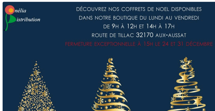
Onélia Distribution : la boutique de Noël à l'italienne.

Depuis près de 25 ans, l'entreprise Onélia Distribution, installée à Aux-Aussat, est spécialisée dans la distribution de produits alimentaires aux saveurs italiennes.