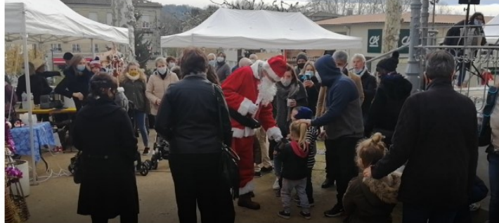
La country vicoise invite le Père Noël !

C'était Noël avant l'heure à Vic-Fezensac ce samedi autour du kiosque.